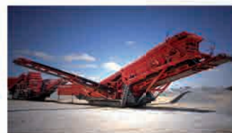
Cribluseuse 694+ - 3 étages