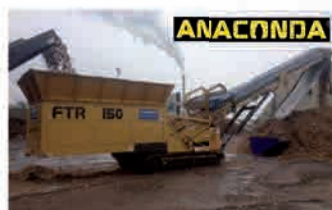
Convoyeur sur chenilles FTR150