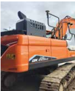
La télématique à l'heure française